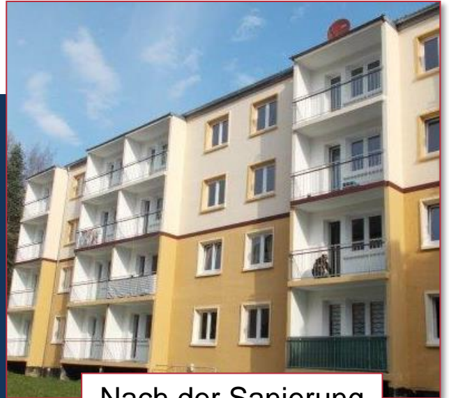
Nach der Sanierung